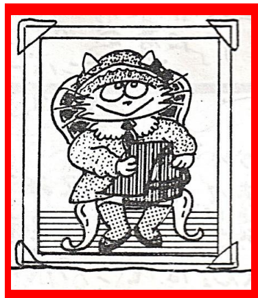
1985ねん4がつ。だい47ごう。 おめかして、きねんさつえ いかな？