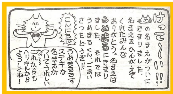
1981ねん5がつ。だい13ごう。うめっこができて1ねん。なまえが「うめまる」にきました。