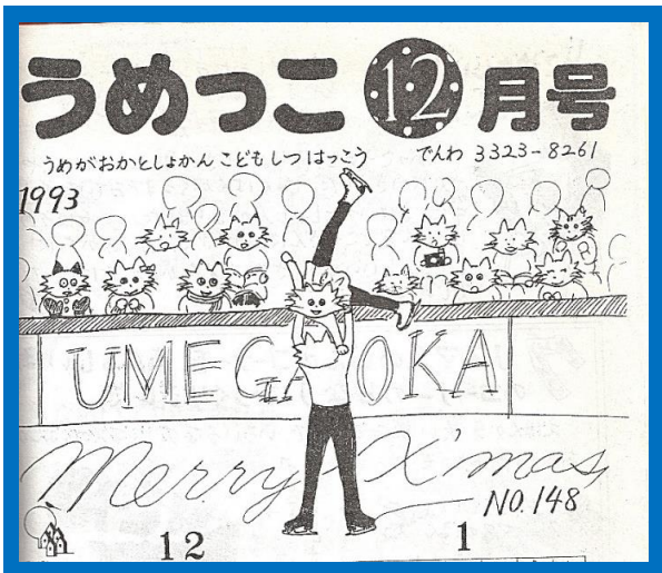
1993ねん12がつ。だい148 ごう。てもあしもすらりとなが い、うしろすがたもスタイル ぱつぐんのうめまる。