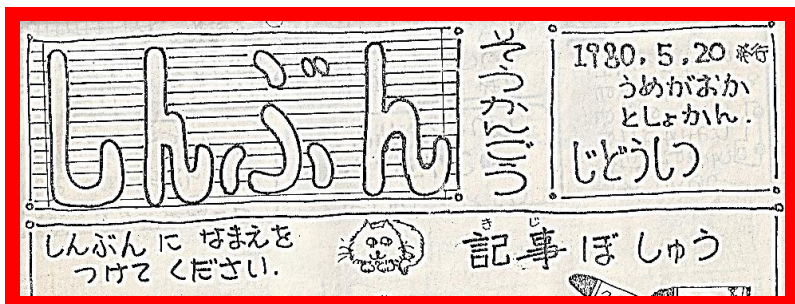
1980ねん5がつ。だい1ごう。 そしてこのねこ。もしかして？

うめがおかとしょかん 梅丘図書館のとしょかんしんぶん第1号が発行されたのは、 いま 今からから42年前の5月です。うめまるの顔もすこしずつ変わってきたようです。